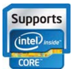
Intel quad core inside

Integrerat stöd på baksidan håller MR14 stående var och när som helst. Enheten är klassad enligt IP65, och portar och anslutningar är väl skyddade.