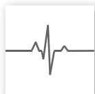
För medicinska miljöer