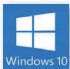
Windows® 10 IoT