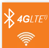
Bluetooth, WiFi, 4GLte 1)