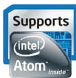
Intel Cherry Trail® Z8350