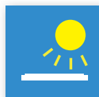
Läsbar i solljus