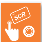
Läsare & kameror