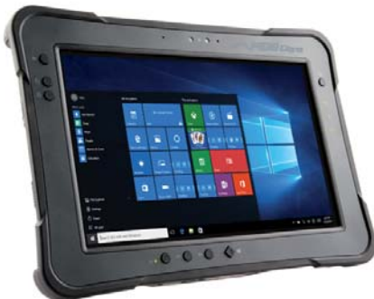
Skyddande ram och distinkta knappar med LED-indikatorer