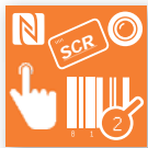
Läsare & kameror