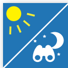
Ljussensor, Hyper Dimming 1)