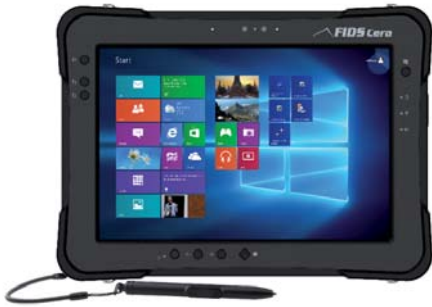
Dual Mode med Kapacitiv Touch och Aktiv Digitizer