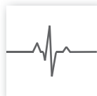
För medicinska miljöer