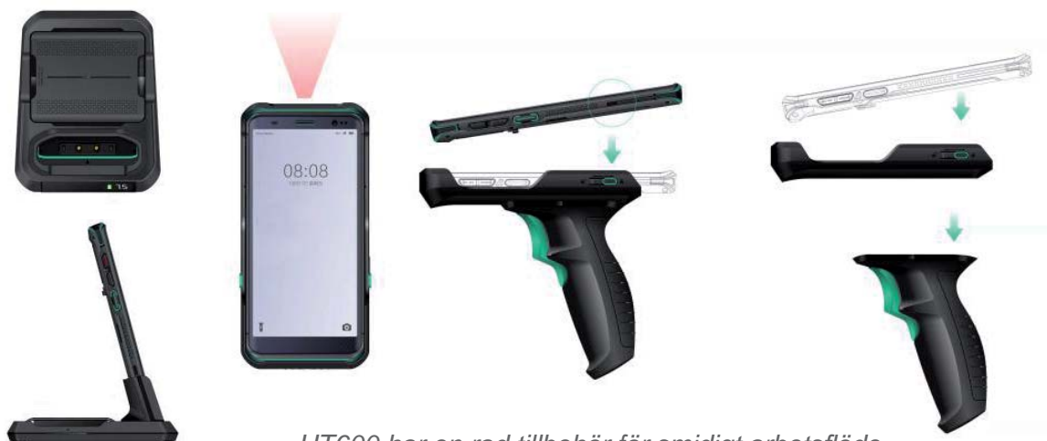
UT600 har en rad tillbehör för smidigt arbetsflöde