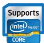
Intel quad core inside

Integrerat stöd på baksidan håller MR14 stående var och när som helst. Enheten är klassad enligt IP65, och portar och anslutningar är väl skyddade.