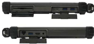
Portar och anslutningar under väl skyddande lock