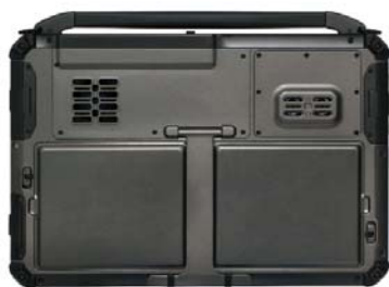
Dubbla batterifack för trygg och säker drift