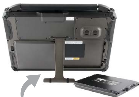
Integrerat utfällbart stödben på baksidan