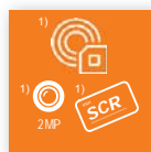
Läsare & Kameror

För mer information kontakta mail@forest-it.se